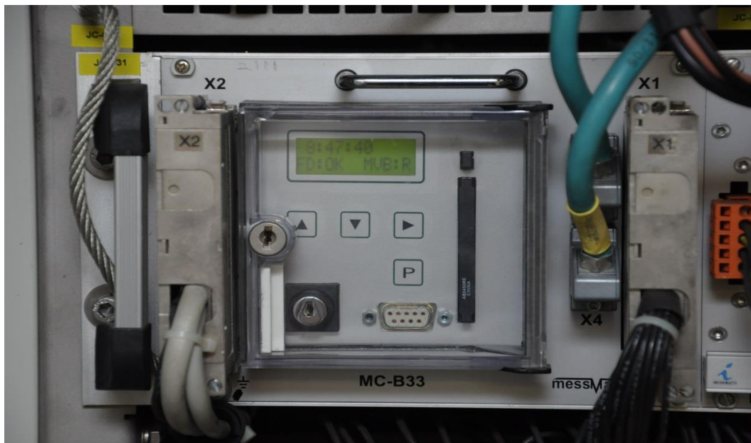
圖 2-10 行車紀錄器

https://www.mobility.siemens.com/global/en/portfolio/rail/automation/signaling-on-board-and-crossing-products/on-board-components.html