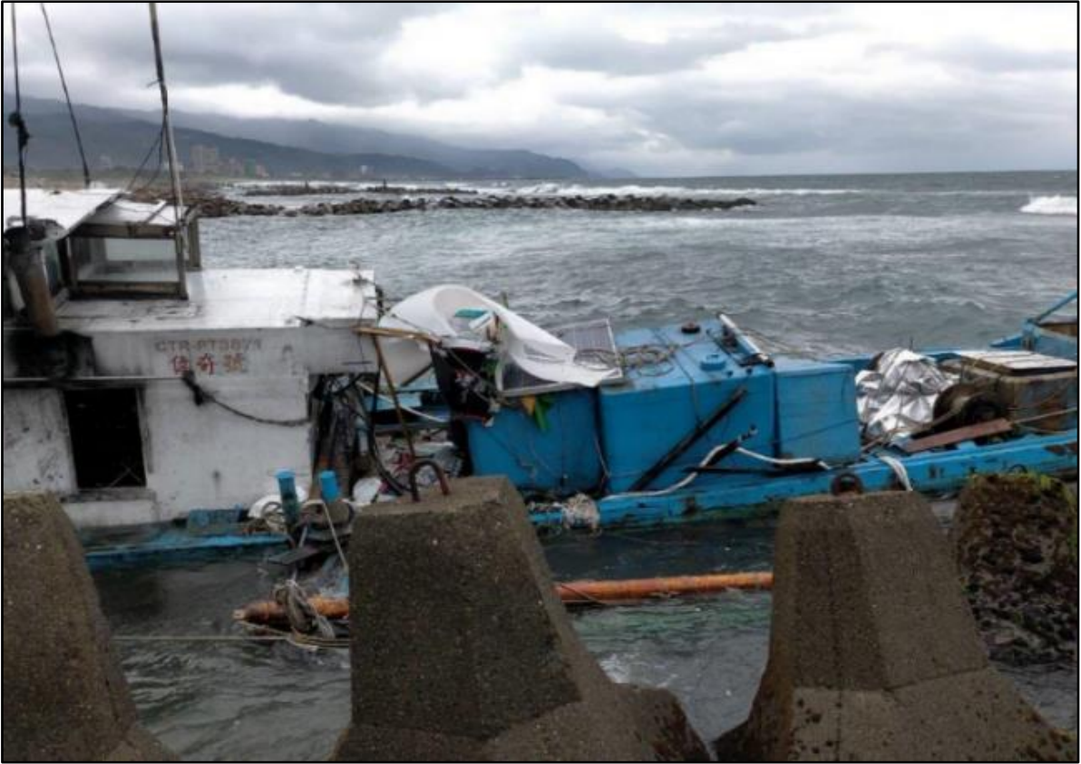
圖 1 偉奇漁筏受損及擱淺照片