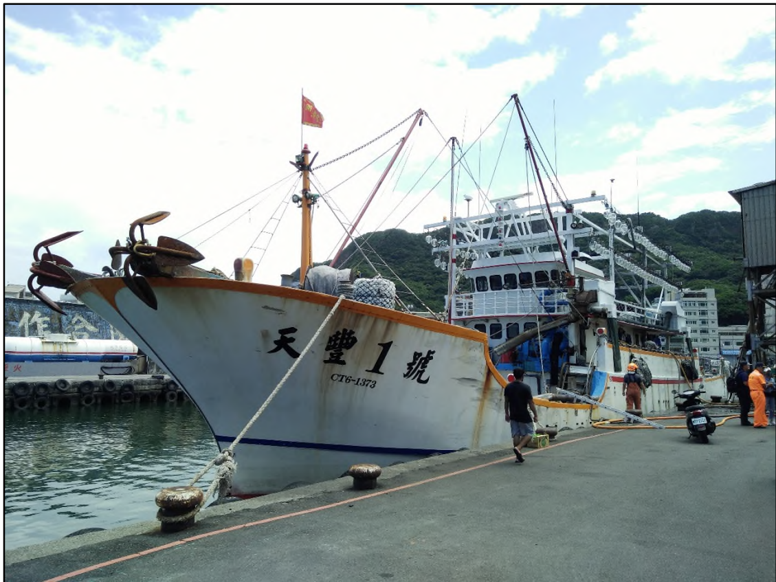
圖 1 豐船消防隊滅火圖

民國 108 年 9 月 12 日 0923 時 1 ，基隆籍漁船天豐 1 號（以下簡稱豐船）（詳圖 1）總噸位 283 2 ，漁船統一編號 CT6-001373，於新北市野柳漁港停泊加油時發生火災，1100 時火勢撲滅，導致豐船船東死亡，輪機長重傷。