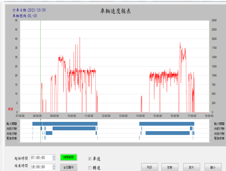
紀錄車輛行駛速度