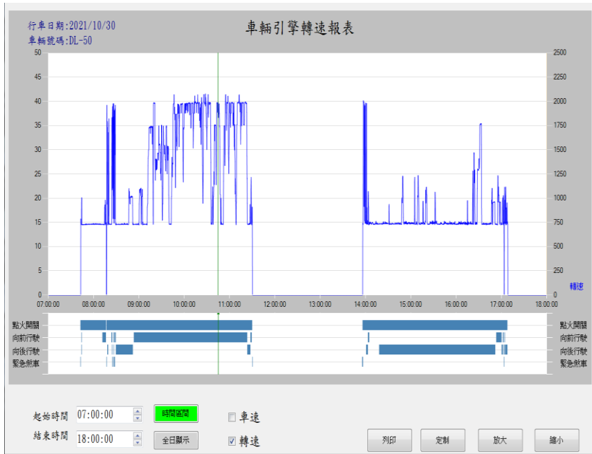
紀錄車輛引擎轉速