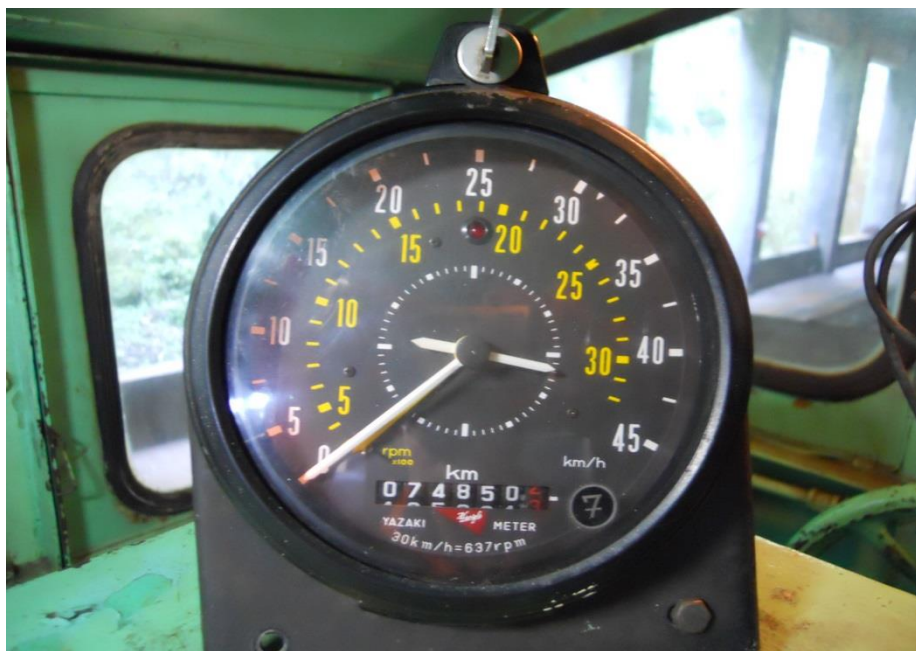
類比式行車速度紀錄器